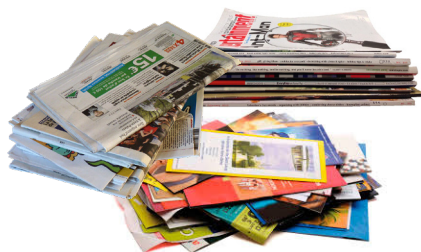
→ COLONNE À PAPIER