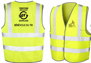
Gilets « bénévole du tri »