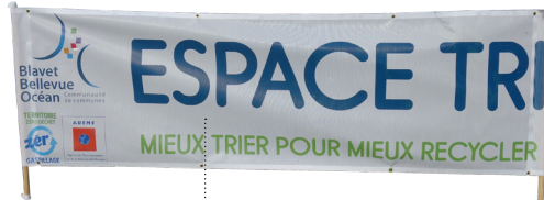
Banderole « espace tri »