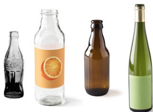
→ COLONNE À VERRE