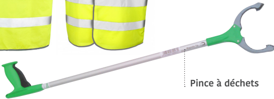
Pince à déchets